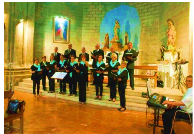
L'ESGLÈSIA PARROQUIAL DE SANTA MARIA DE MAIALS