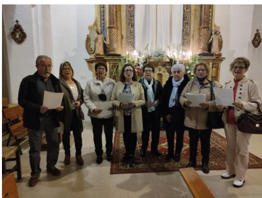
A L'ESGLÈSIA PARROQUIAL DE SANT MIQUEL D'ALMATRET (a l'esquerra). ACOMPANYANT LA PROCESSÓ ( a la dreta).